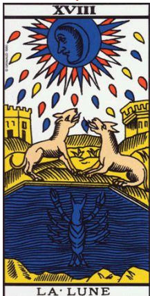
La Lune, lame 18